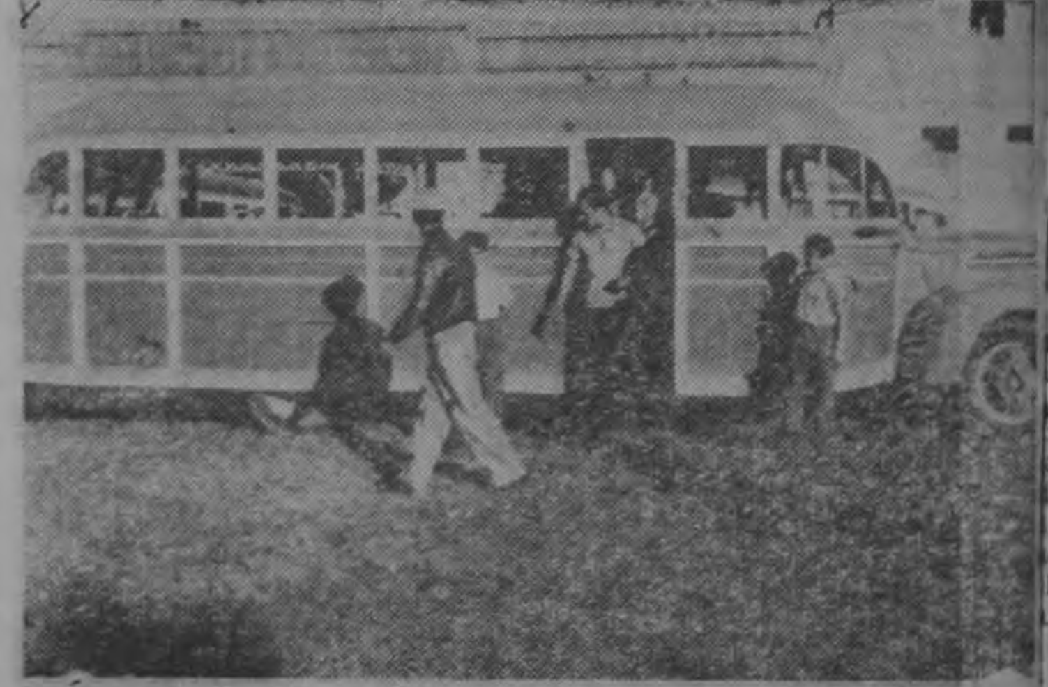
A la plaza de la Artillería llegan camiones que luego saldrán, debidamente custodiados, para atender el servicio de pasajeros.