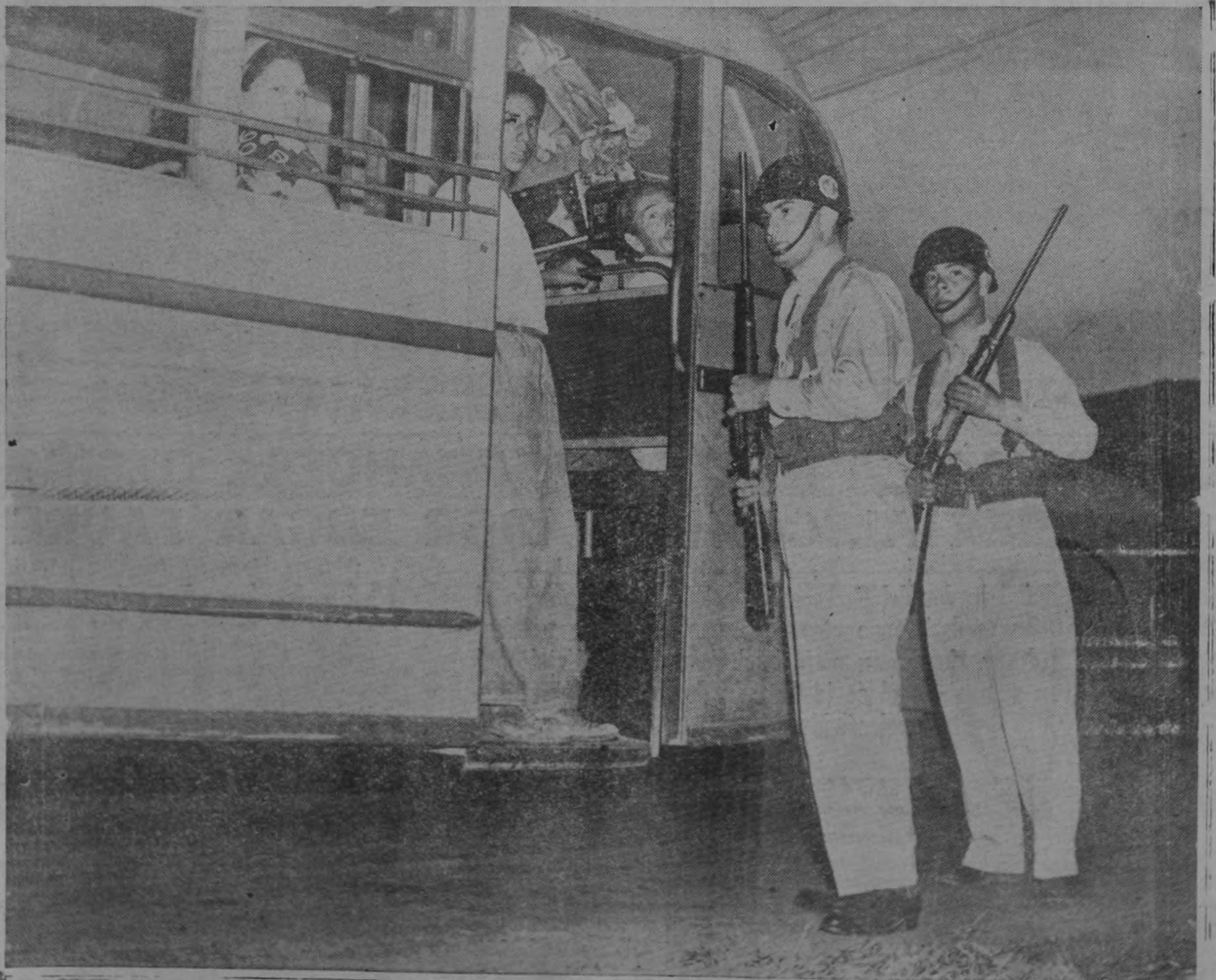
LA GUARDIA CIVIL CUSTODIA. — Guardias civiles, convenientemente armados, cus todian los autobuses del servicio interurbano que no participaron en el paro de la tarde de ayer.