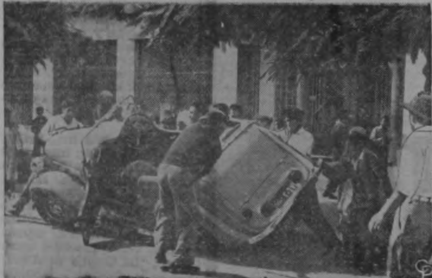
Arriba, soldados británicos montan guardia a la entrada del campo Moascar, en Ismailia, Egipto. Mientras, tropas británicas y guerrilleros egipcios libaban una batalla de todo un día cerca de la base británica de abastecimientos de Tel el-Kebir. Se informa que en esa acción 17 personas perdieron la vida. Abajo, egipcios amotinados vuelcan un automóvil frente al Cuartel General Británico en Port Saïd.