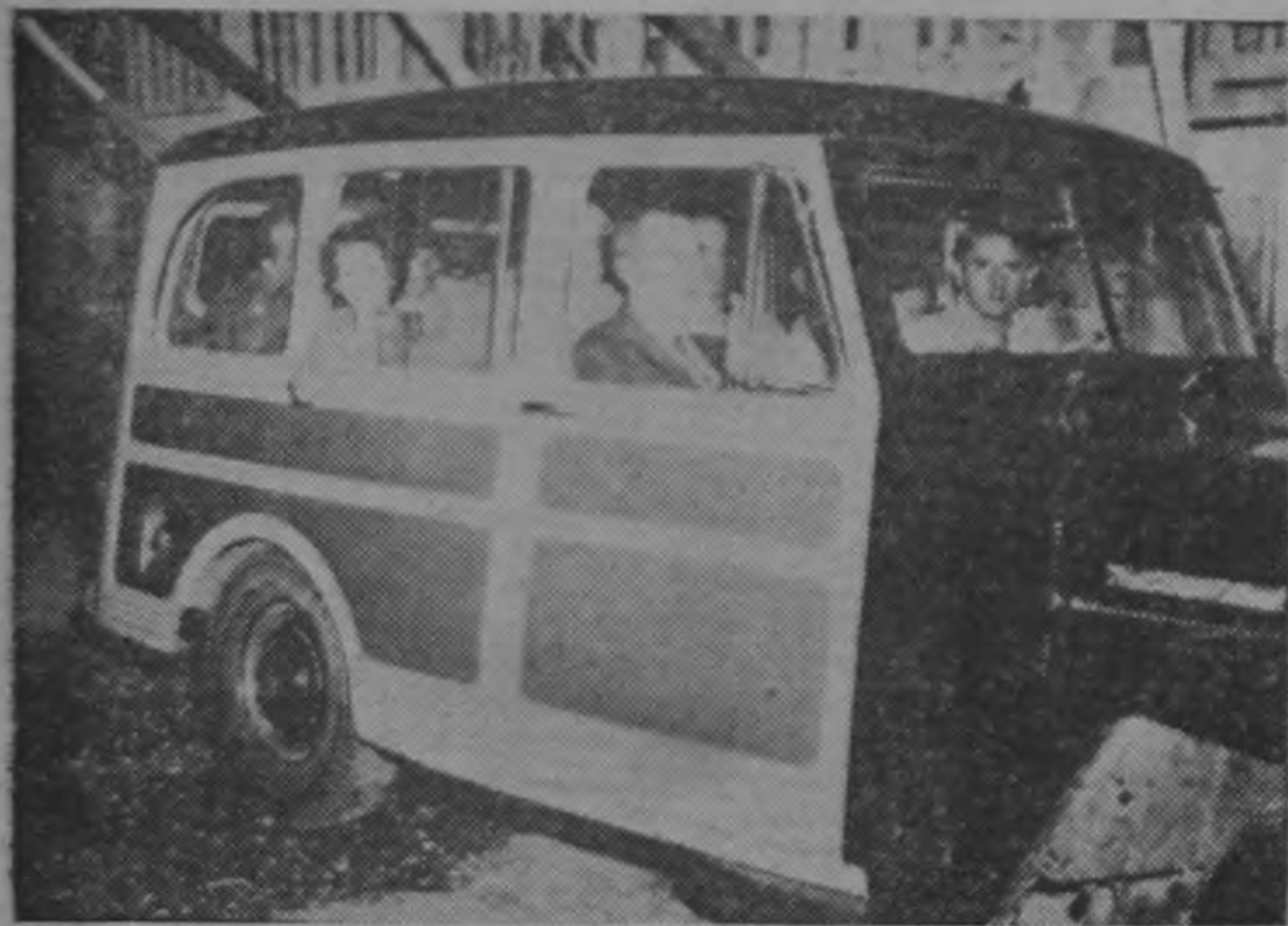
Algunos garajes pusieron ayer unidades a cubrir las rutas de servicio interurbano, supliendo así la falta de autobuses, y evitando el paro en los transportes.