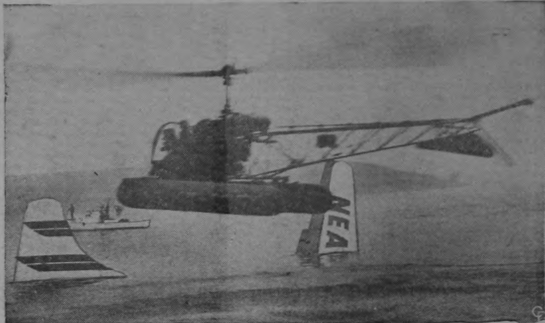
Un helicóptero de las autoridades portuarias de Nueva York, vuela sobre la cola y un ala del avión de la Northeast Airline que cayó en el East River de Nueva York con 36 personas a bordo. Fueron salvados 33 de sus ocupantes. El accidente ocurrió mientras el avión trataba de aterrizar en el aeródromo LaGuardia, en medio de una densa neblina.—(INP).