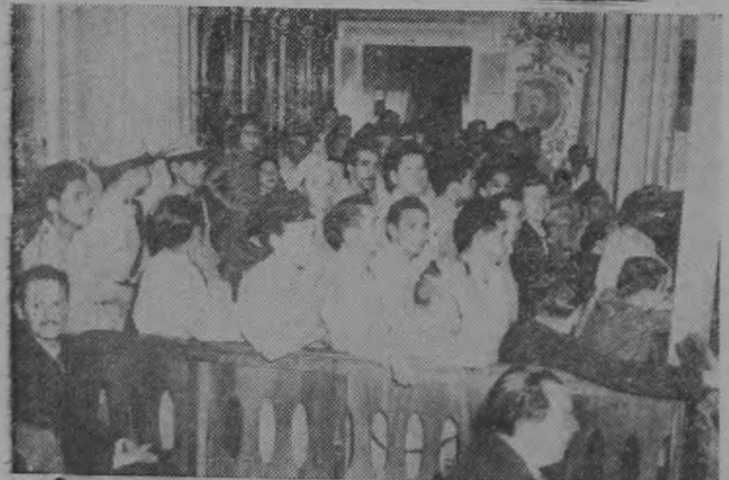
Las barras de la Asamblea Legislativa resultaron estrechas para la numerosa concurrencia de choferes y cobradores, que acudieron a apoyar el alza de tarifas.