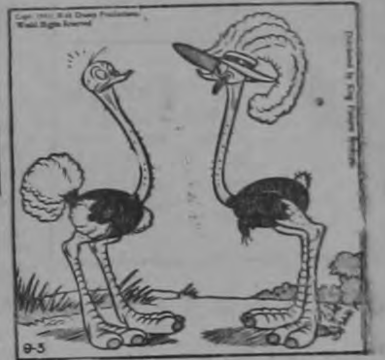
—¡Tomé la idea de una revista de modas!